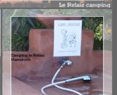
Camping le Relais Marrakech