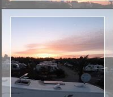
Camping le Relais-Marrakech