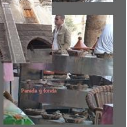
Parada y fonda